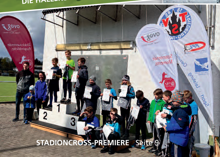
STADIONCROSS-PREMIERE Seite 9