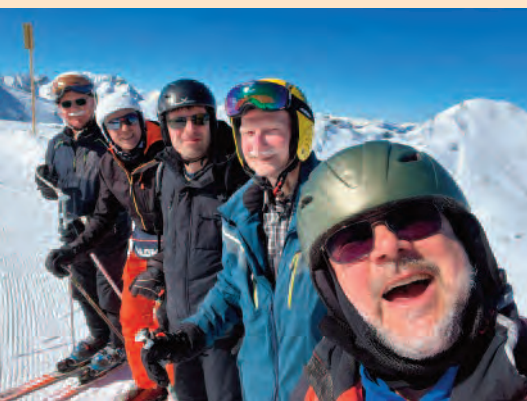
Die fünf TSV-Skifahrer im Selfie.