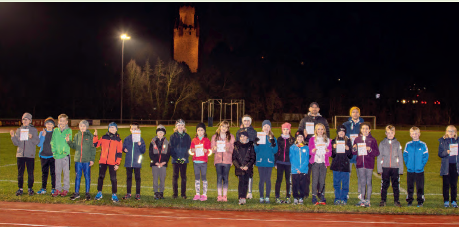
Insgesamt 80 Sportabzeichen wurden vom TSV abgenommen. Ein toller Wert! Unser Foto zeigt die Auszeichnung einiger Kids.

wegen erhielt der Sportkreis regelmäßig von mir einen weiteren Datensatz mit dem Hinweis, dass das aber wirklich die letzte Lieferung gewesen ist. Kurz vor Weihachten habe ich dann die tatsächlich letzte Urkunde in Echzell geholt, verbunden mit einem Weihnachtsgeschenk als Dankeschön. Deshalb kommt jetzt nach der Kurzfassung in der letzten SPRINT noch ein Presseartikel von Martin Göller zu dem Thema.