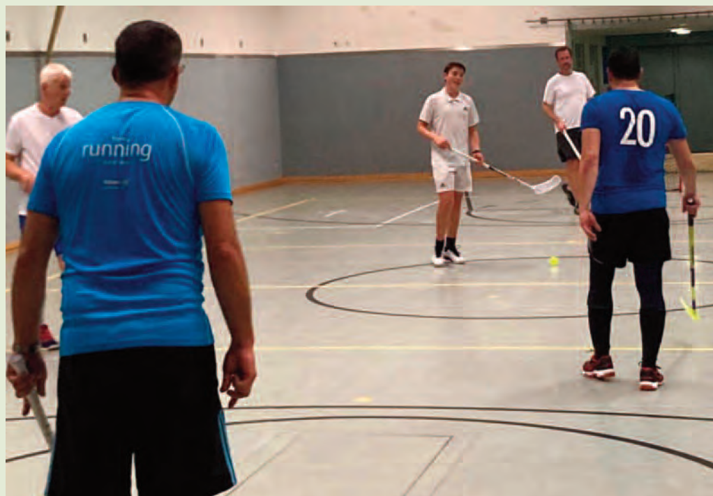
Blick in die TSV-Turnhalle auf das Training der Floorballer.

Was genau ist eigentlich Floorball? Die Sportart ähnelt dem Eishockey, ist also mega cool. Mit Sportklamotten und Schläger gewappnet, kann es schon losgehen. Die „Schnupperschläger“ stellt der Verein.