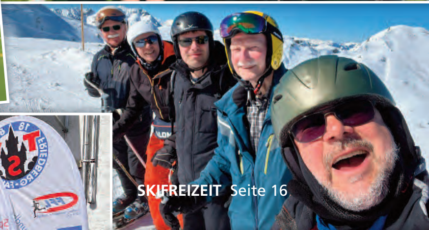
SKIFREIZEIT Seite 16