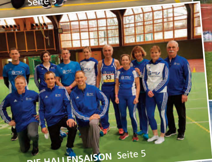
DIE HALLENSAISON Seite 5