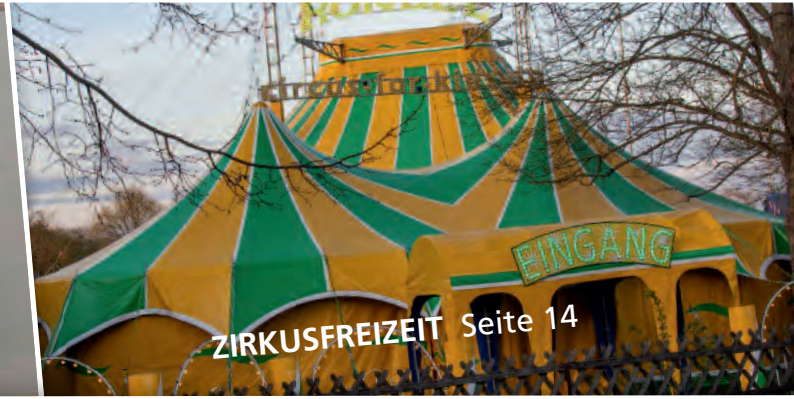
ZIRKUSFREIZEIT Seite 14