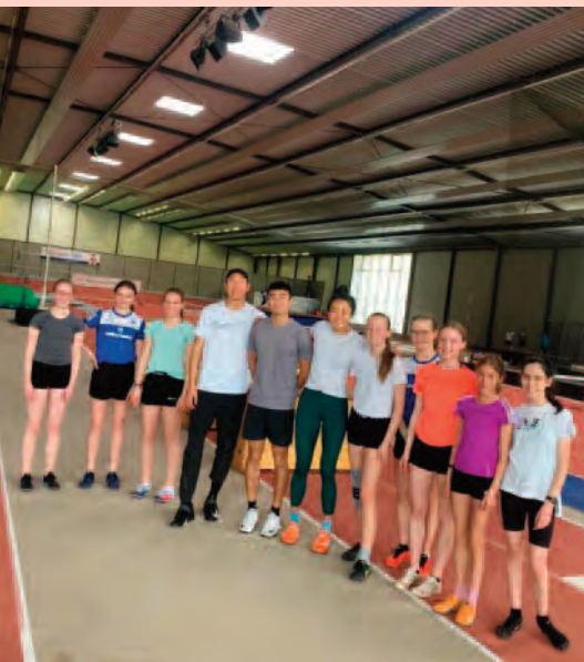
Auch in der Halle kann die Truppe top für ein Foto posieren.