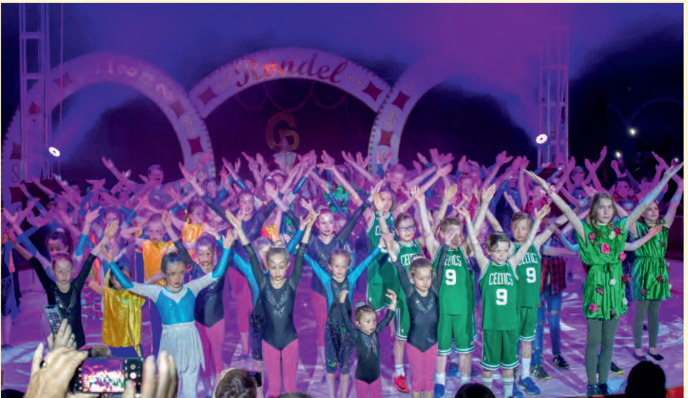
Tolles Abschlussbild nach einer beeindruckenden Gala-Vorstellung der Kids.