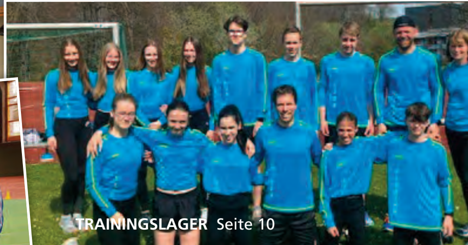
TRAININGSLAGER Seite 10