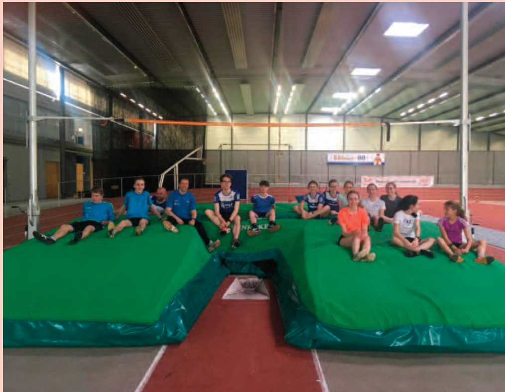
Kurze Foto-Pause auf der Stabhochsprungmatte, bevor es mit dem Training weitergeht.