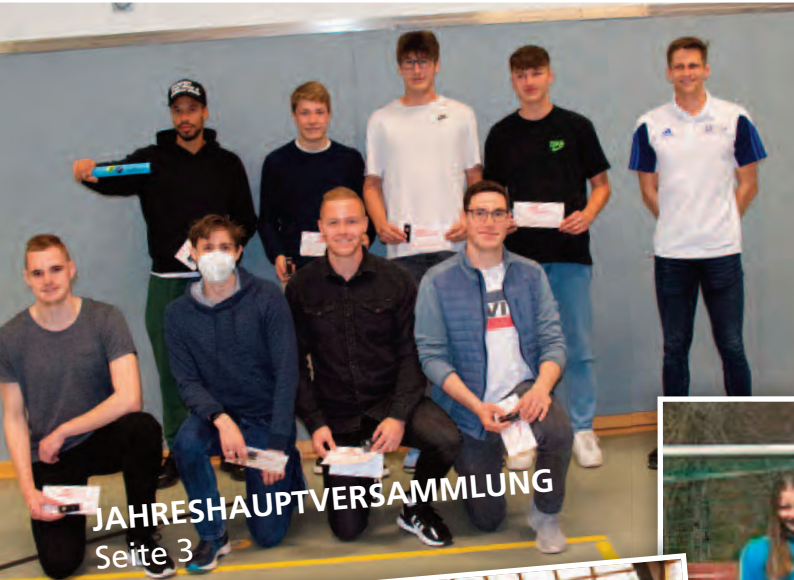
JAHRESHAUPTVERSAMMLUNG Seite 3