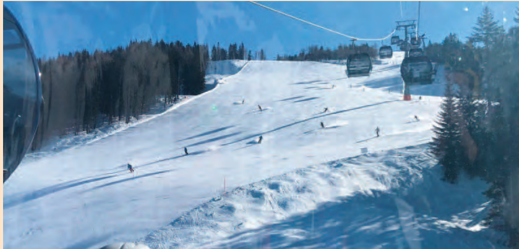
Toller Blick hinunter auf die Piste.

daher bereits am Vor-Wochenende ins benachbarte Wagrain ein. So bildeten wir wenigstens für zwei überlappende Skitage immerhin eine Siebener-Gruppe.