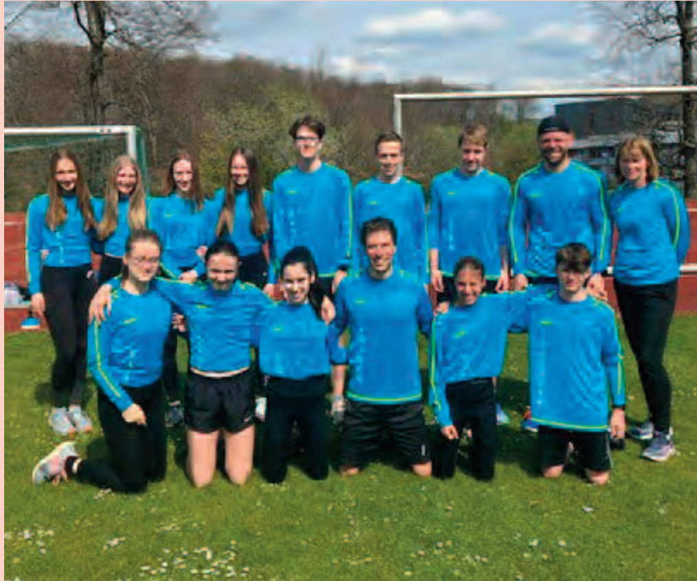
Gruppenfoto auf dem Rasen.