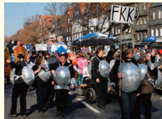
Wolken, Wind und Regen oder Sonnenschein: die FKKler sind immer am Start.

Mit Helau und neuen Kostümen werden wir bestimmt auch in der Kampagne 2019/2020 wieder durch Friedbergs Straßen ziehen. Fröhliche Mitmacher sind immer willkommen!