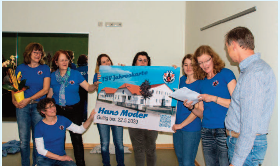
Außerdem gab es eine TSV-Jahreskarte für Moder.

für den Sport direkt auf den Weg brachte. Die Spitzensportförderung des Landes Hessen ermöglicht eine befristete Beschäftigung von Trainer Otmar Velte zur Gestaltung des Hochleistungssporttrainings sowie der gezielten Vor-