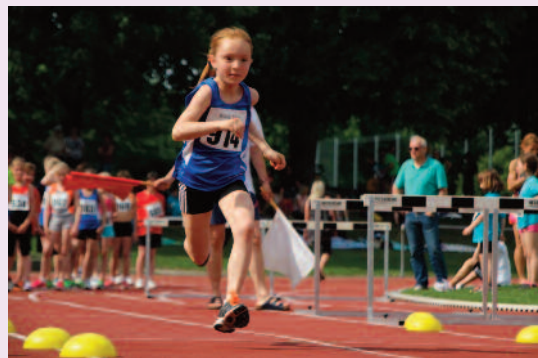
Diese junge Athletin ist schnell unterwegs über die 30 Meter fliegend