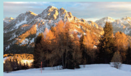
Panorama von der Terrasse des Rifugio Panorama