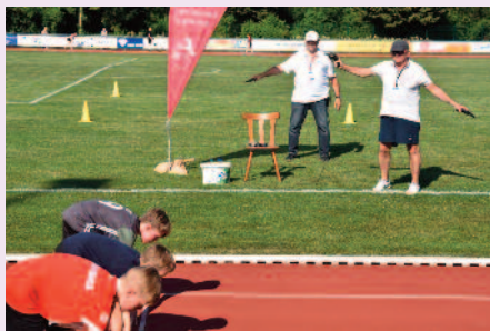
Das TSV-Starterteam steht bereit für den nächsten Startschuss.