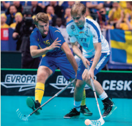
Seit März 2019 wird beim TSV Floorball – der Mix aus Eis- und Feldhockey – angeboten.

Floorball – das klingt schön. Jede/jeder sollte Floorball einmal ausprobieren. Aber was genau ist das eigentlich? Floorball ist auch als Unihockey bekannt. Seit März 2019 wird beim TSV Friedberg-Fauerbach der Mix aus Eis- und Feldhockey angeboten. Die rasante Sportart mit leichtem Schläger und löchrigem Ball sorgt für körperliches Wohlbefinden und ausgelassene Stunden. In Skandinavien und der Schweiz wissen sie das schon seit den 70er Jahren. Dort