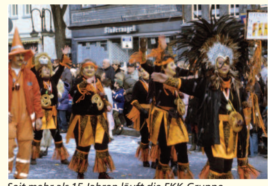
Seit mehr als 15 Jahren läuft die FKK-Gruppe beim Faschingsumzug in der Kreisstadt mit