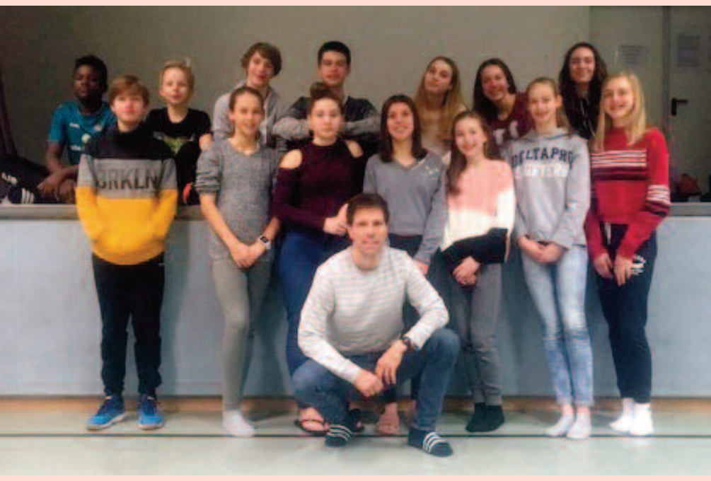
Schon etwas länger her ist das Wintertrainingslager der TSV-Nachwuchsatleten, das wieder in den Weihnachtsferien „zwischen den Jahren“ in der Turnhalle stattfand.