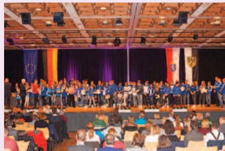
Blick durch die volle Stadthalle hindurch Richtung Bühne.

solche Erfolge überhaupt nicht feiern“, so Antkowiak.