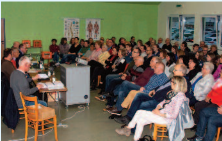
Blick in den vollbesetzten Gymnastikraum der Fauerbacher Turnhalle.