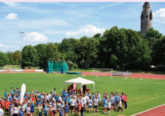
Blick auf den Friedberger Adolfssturm und die vielen Jungs und Mädels während des Wettkampfs.

Ein ganz besonderes Jubiläum feiert die LG ovag Friedberg-Fauerbach am 22. Mai 2019 mit ihrem Sponsor OVAG Energie AG. Bereits zum zehnten Mal findet der Sprint-Cup für Schülerinnen und Schüler der Jahrgänge zwischen 2006 und 2011 (und jünger) statt. In Zei-