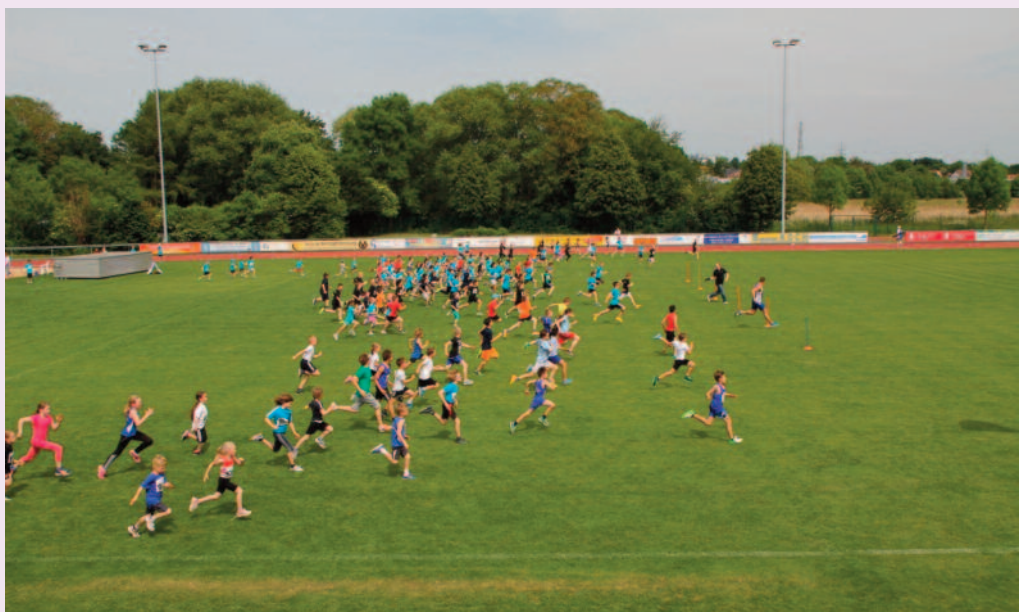
Bevor es „richtig“ losgeht, machen sich alle Teilnehmer erstmal mit den Top-Athleten der LG ovag warm – und da gehören kurze Sprints natürlich auch dazu.