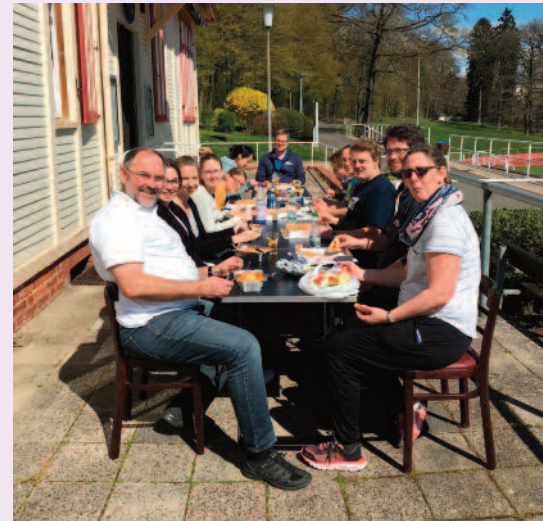
Gemeinsames Mittagessen bei bestem Wetter mit Blick auf den Waldsportplatz in Bad Nauheim.