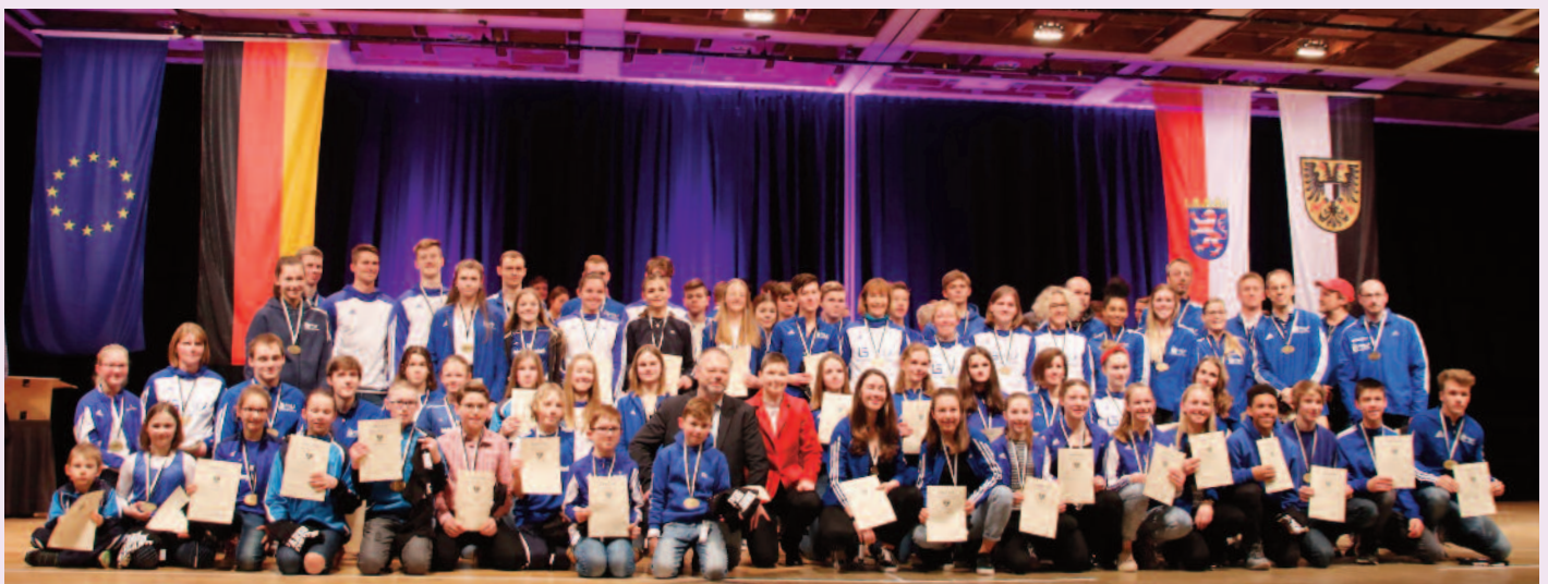
Um alle auf das Gruppenfoto unserer geehrten Sportlern zu bekommen, hat es ein paar Minuten gedauert. Die LG stellte die meisten Geehrten.