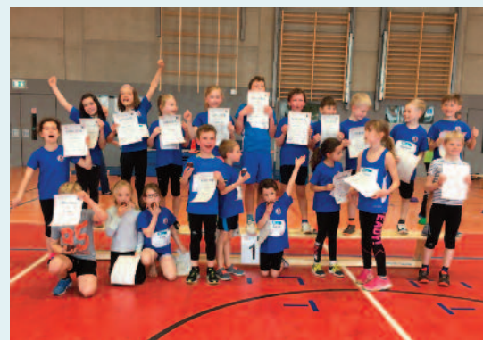
Viele glückliche Gesichter und Jubel bei den TSV-Kids beim KiLa-Wettbewerb in Rodheim.

Für die TSV-Flitzer war der Wettkampf in Rodheim damit ein erfolgreicher Auftakt in die KiLa-Cup-Saison. Denn auch in diesem Jahr richtet der Leichtathletik-Kreis Wetterau wieder eine Serie mit verschiedenen KiLa-Veranstaltungen aus, die Mitte September in Melbach ihren Abschluss findet.