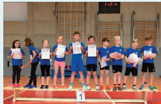
Schönes Gruppenbild der TSV Flitzer bei der Siegerehrung.