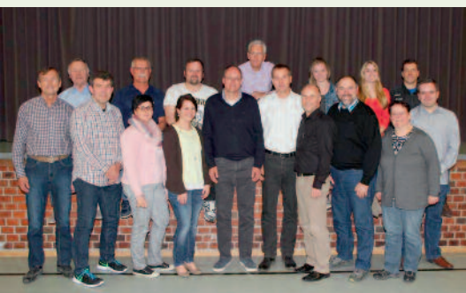
Der neu- bzw. wiedergewählte Vorstand des TSV