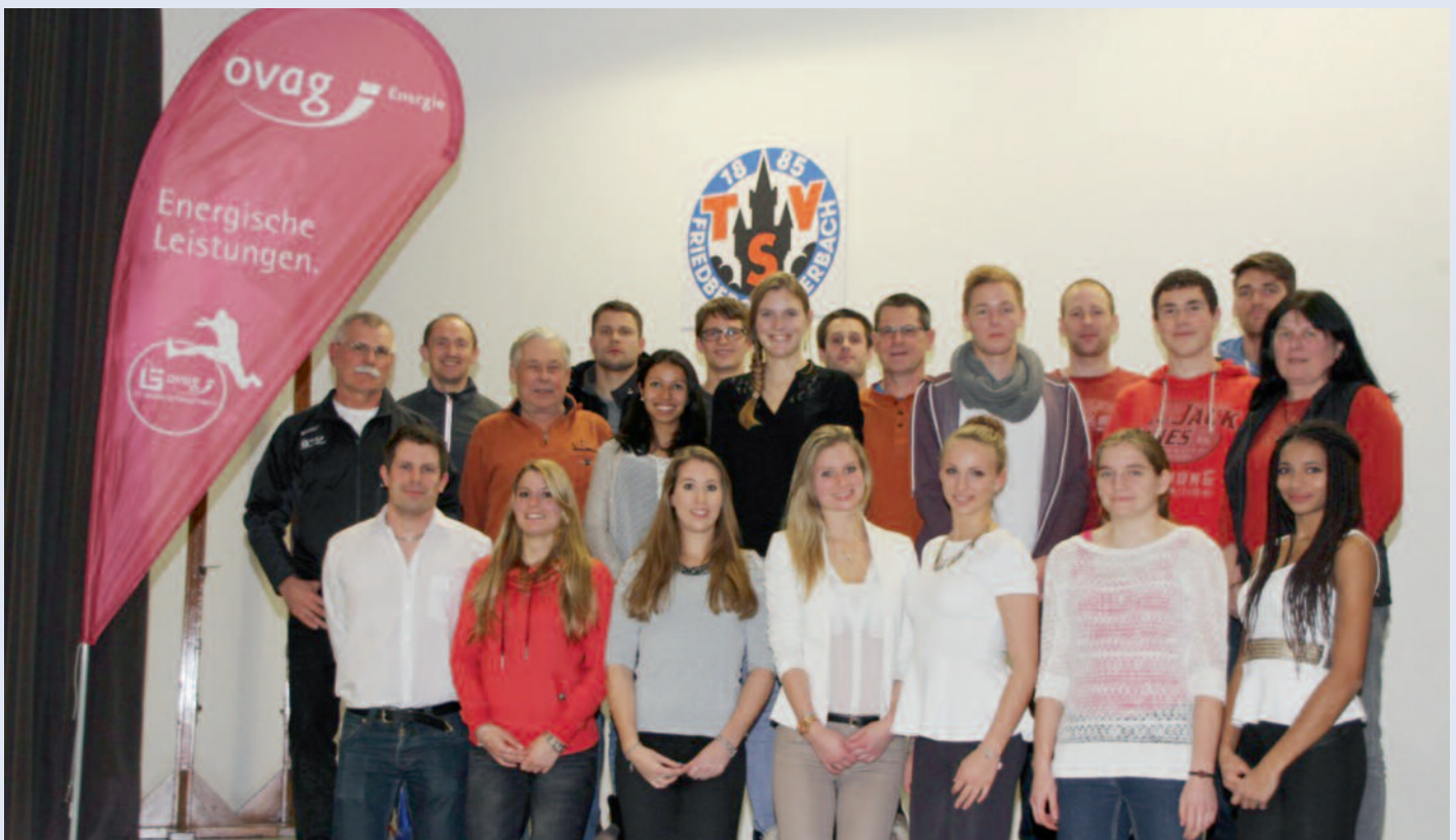
Die erfolgreichsten LG-Athleten und ihre Trainer