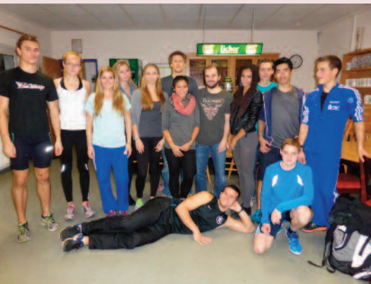
Die Teilnehmer des Hallendreikampfes