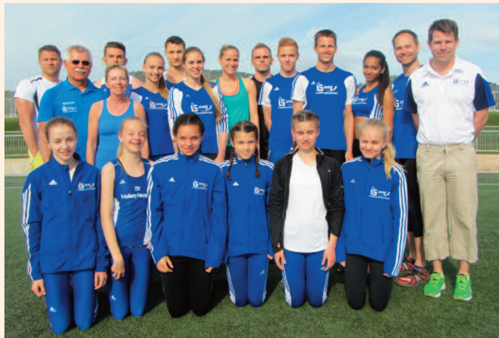
Die TSV Aktiven bei schönem Wetter im Trainingslager auf Mallorca

Pohl: Mein Ziel ist es erstmal nur, mich schmerzfrei zu bewegen und dann langsam wieder aufzubauen.