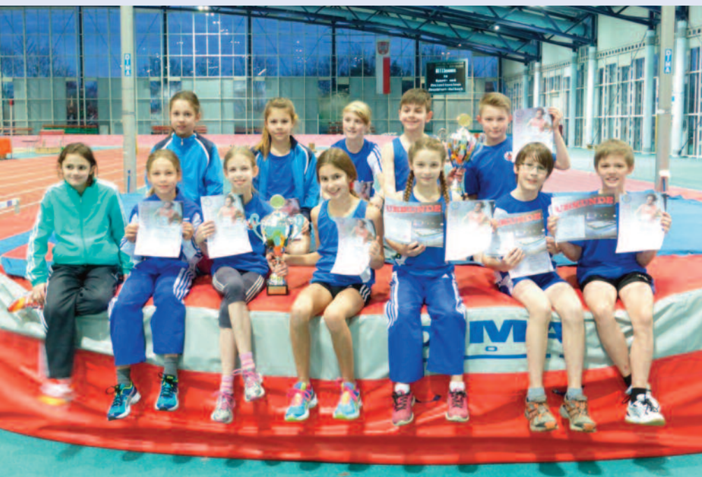
Die ganze Truppe des TSV U12 mit den beiden Pokalen für die erfolgreichste Mannschaft/den erfolgreichsten Verein bei den Mädchen (TSV!) und die erfolgreichste Mannschaft/den erfolgreichsten Verein bei den Jungen (TSV!). Diese Pokale wurden nicht nur für den Wetteraukreis vergeben, sondern gelten für die gesamte Veranstaltung, also die Kreise Hochtaunus, Maintaunus und Wetterau zusammen.