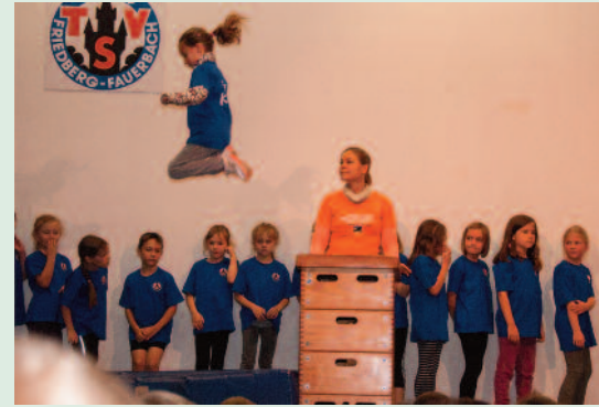
Die Kleinsten zeigten verschiedene Sprünge vom Kasten