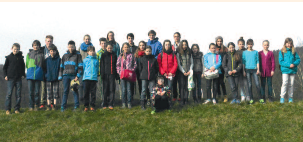
27 TSV-ler fahren mit ins Ostertrainingslager nach Bad Blankenburg