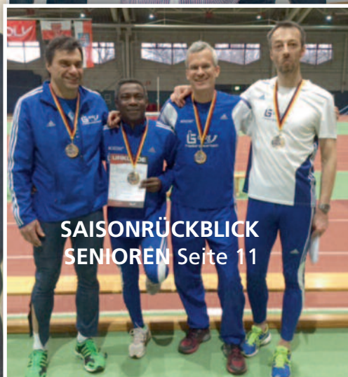
SAISONRÜCKBLICK SENIOREN Seite 11