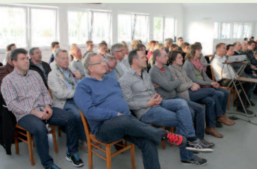
Blick in die Runde während der Sitzung