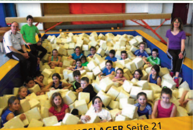
OSTERTRAININGSLAGER Seite 21