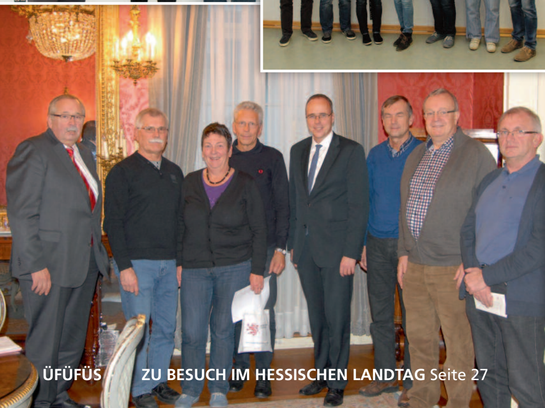
ÜFÜFÜS ZU BESUCH IM HESSISCHEN LANDTAG Seite 27