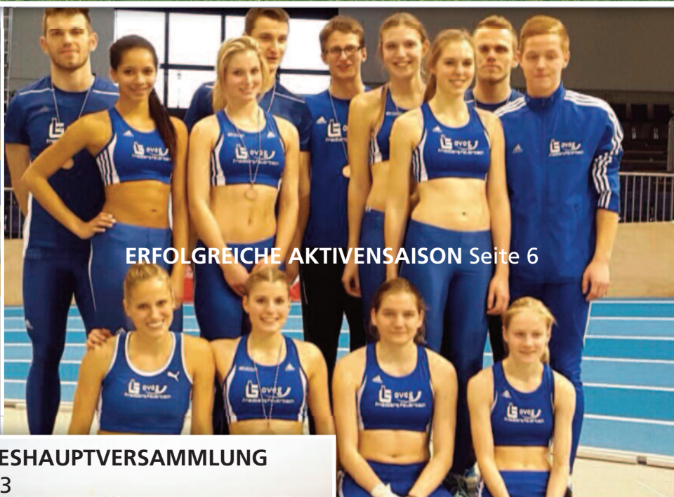
ERFOLGREICHE AKTIVENSAISON Seite 6