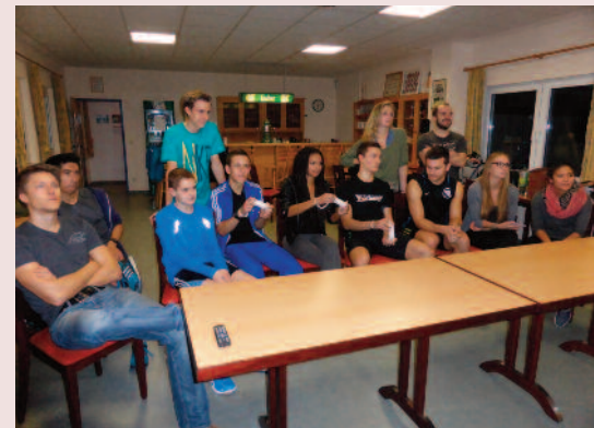
Zum Abschluss stand Mario Kart auf dem Programm