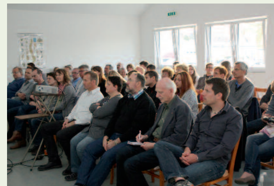
Blick auf die versammelten TSV-Mitglieder