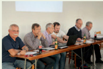
Blick auf den Vorstand während der Sitzung