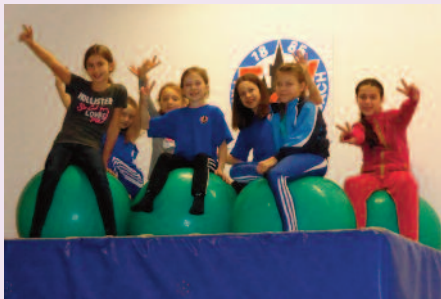
Die TSV-Mädels machen es sich auf den Gymnastikbällen bequem

Nach neun Jahren Pause hat die Trainingsgruppe der U12 eine alte Tradition wieder aufleben lassen: In den letzten Tagen der Winterferien wurde erstmalig nach 2006 wieder ein dreitägiges Trainingslager in den Räumen der vereins-eigenen TSV-Halle mit zwei Übernachtungen, Selbstverpflegung und zwei Mal täglich Training durchgeführt. 16 Mädchen und Jungen im Alter von 9 bis 11 Jahren nahmen daran teil und hatten beim Schlafen auf Turnmatten, Kochen, Abwaschen, Kinoabend mit DVD-Filmen und reichlich Sport viel Spaß. „Außer Klagen über Muskelkater habe ich sowohl von den Kindern, als auch von den Eltern nur positives Feedback bekommen,“ äußerte sich Trainer