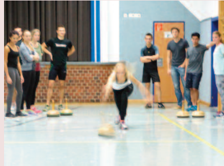
Disziplin Nummer zwei: Bosseln

Als erste Disziplin war Basketball an der Reihe. Jede Mannschaft hatte 4x5 Minuten Spielzeit, es stand also Vollgasbasketball auf dem Plan, Teamgeist und