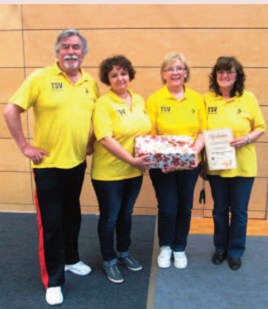
Sucht „Nachwuchs“: die Bossel-Gruppe des TSV

Von den neun Spielen des hervorragend organisierten Turniers wurden sechs Spiele gewonnen, ein Spiel unentschieden gespielt und zwei Spiele verloren. Keine Mannschaft erzielte einen höheren Punktestand. Die anderen Podestplätze belegten Kelsterbach und Wörrstadt.