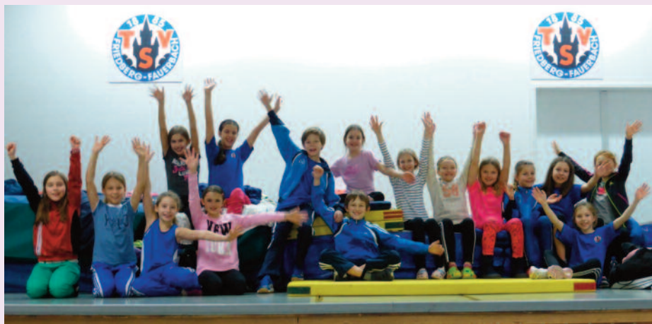
Die 16 Jungs und Mädels beim Gruppenfoto